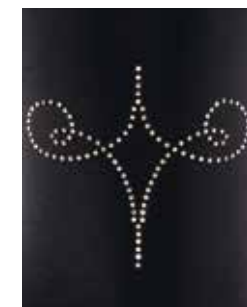
Beauty auf Schwarz