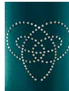
Romance auf Smaragd

Neue, attraktive Motive sorgen speziell in Kombination mit den dunkleren Farbtönen für ganz besondere Effekte. mediven elegance und mediven plus lassen sich mit den funkelnden Motiven veredeln.